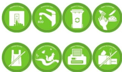
Des stickers pour les éco-gestes