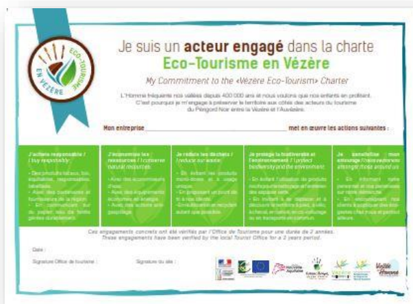
Un diplôme bilingue