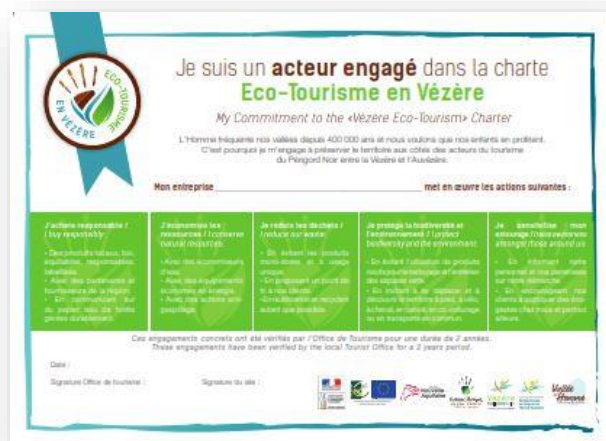
Un diplôme bilingue